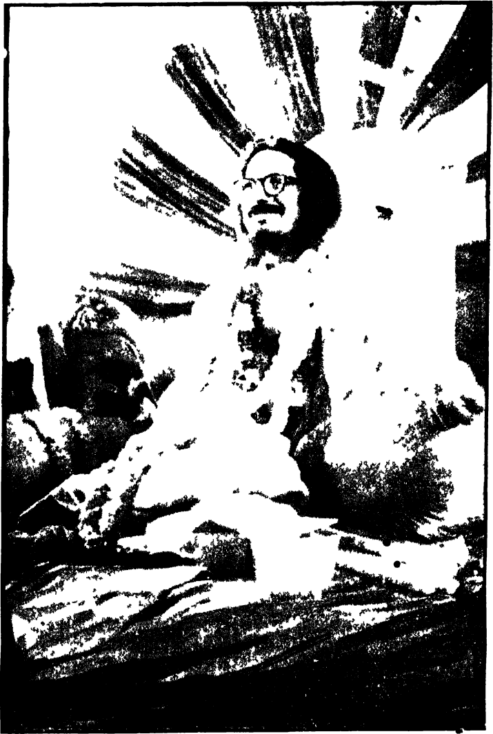
জ্যোতিষ কনক-বিগ্রহ .দেবসাব ।